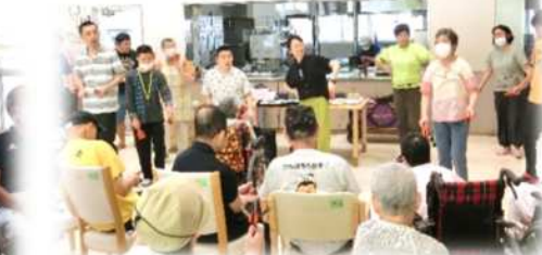
また来て下さいね♪