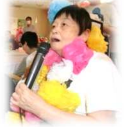
ふたりを～タやみが～