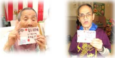
お祝いカードもらいました！