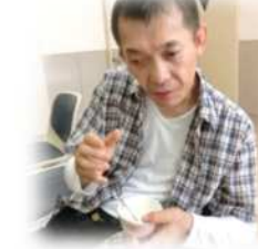
バニラを選んだよ！