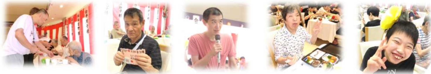
お祝いカード贈呈