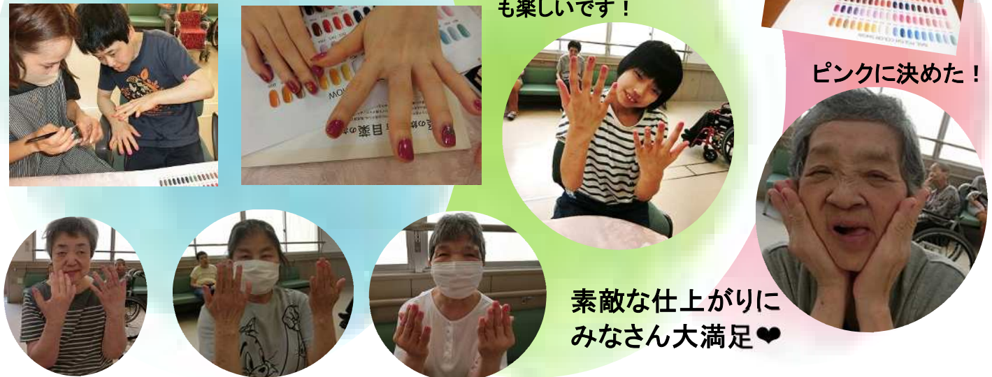
素敵な仕上がりにみなさん大満足♡