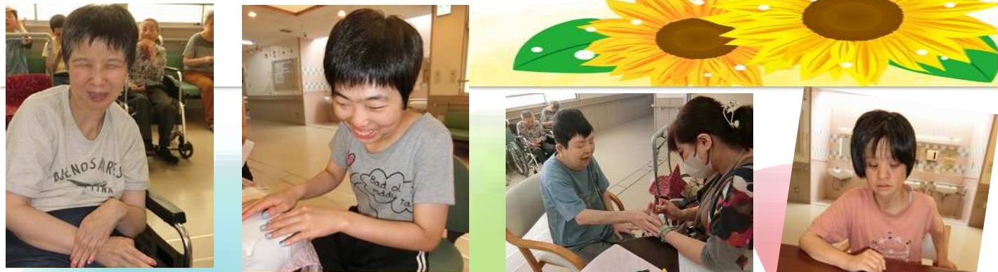
今日は何色にしようかな～♪

7月15日、ネイルDAYでした。女性の皆さんはとても心待ちにしておられ、「今回はどんな色にしよう?」「何色がいいと思う?」など、わくわくでいっぱい!好きな色を選んで、ネイリストの方とのお話を楽しまれて、とても良い時間を過ごされていました。また次回をお楽しみに～☆